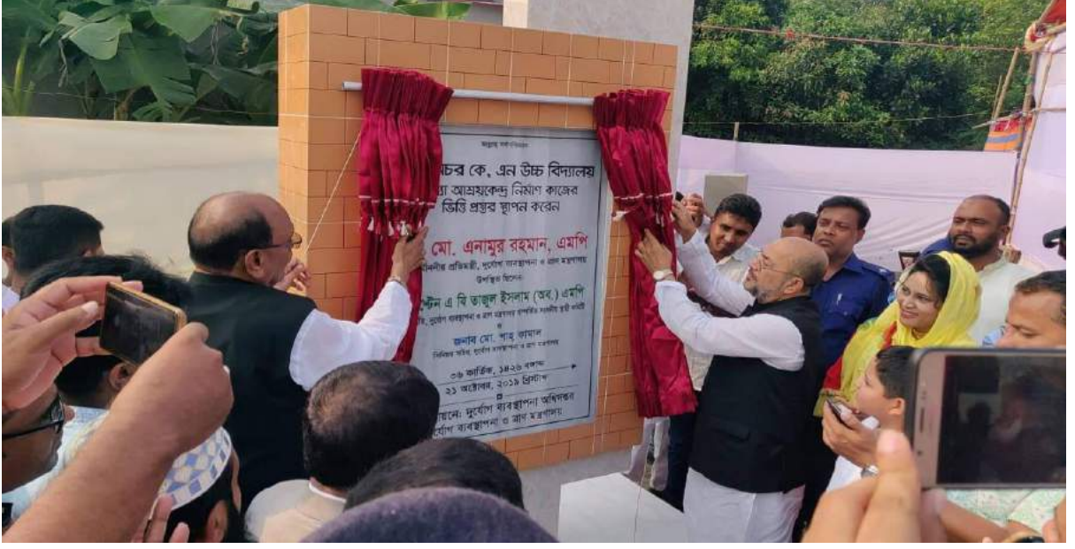
চিত্রঃ ০১ ব্রাহ্মণবাড়ীয়া জেলার বাঞ্ছারামপুর উপজেলার উজানচর কে.এন উচ্চ বিদ্যালয় বন্যা আশ্রয়কেন্দ্র নির্মাণ কাজের শুভ উদ্বোধন করেন মাননীয় প্রতিমন্ত্রী ডাঃ মোঃ এনামুর রহমান এমপি উপস্থিত ছিলেন দুর্যোগ ব্যবস্থাপনা সম্পর্কিত স্থায়ী কমিটির সভাপতি ক্যাপ্টেন এবি তাজুল ইসলাম (অব.) এমপি।