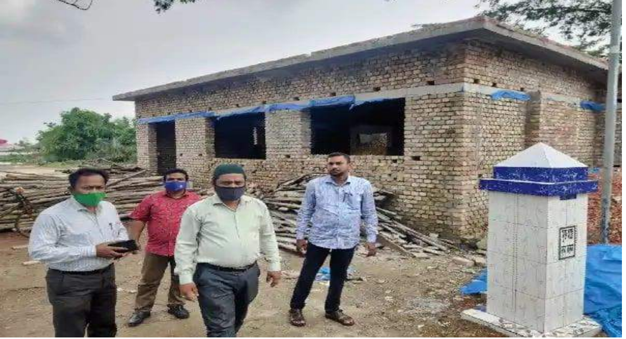
চিত্রঃ ১৫ পাতড়াখোলা পাচুর মোড় পাঞ্জগানা জামে মসজিদ সংস্কার কাজ, ইউনিয়ন- রমজাননগর, উপজেলা-শ্যামনগর, জেলা- সাতক্ষীরা, পরিদর্শন করেন- ডিআরআরও, সাতক্ষীরা ও পিআইও শ্যামনগর।