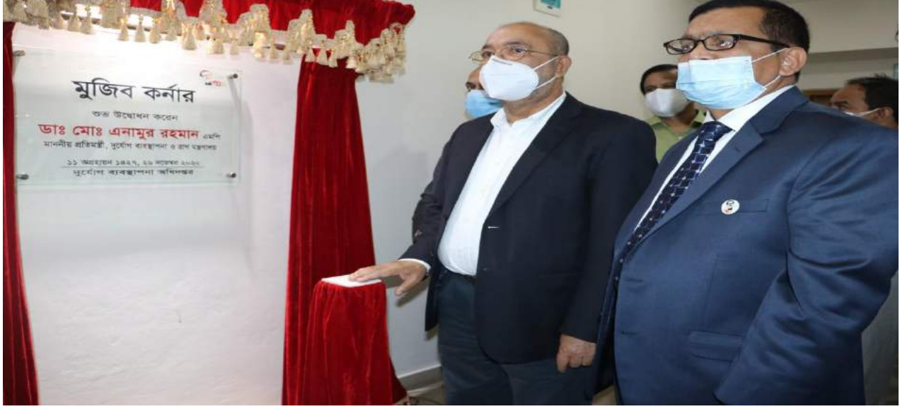
চিত্রঃ ০১ ডাঃ মোঃ এনামুর রহমান এমপি, মাননীয় প্রতিমন্ত্রী, দুর্যোগ ব্যবস্থাপনা ও ত্রাণ মন্ত্রণালয় কর্তৃক দুর্যোগ ব্যবস্থাপনা অধিদপ্তরে স্থাপিত মুজিব কর্ণার এর শুভউদ্বোধন।

১.৩.১ জাতির পিতা বঙ্গবন্ধু শেখ মুজিবুর রহমান ঐর জন্মশতবার্ষিকীতে এ অধিদপ্তরে মুজিব কর্ণার স্থাপন করা হয়েছে। জাতির পিতা বঙ্গবন্ধু শেখ মুজিবুর রহমান ঐর আত্মজীবনীমূলক গ্রন্থসহ তাঁর কর্ম ও মুক্তিযুদ্ধের সংগ্রামী জীবনের উপর ৫১৭টি বই ক্রয় করে মুজিব কর্ণারে রাখা হয়েছে।