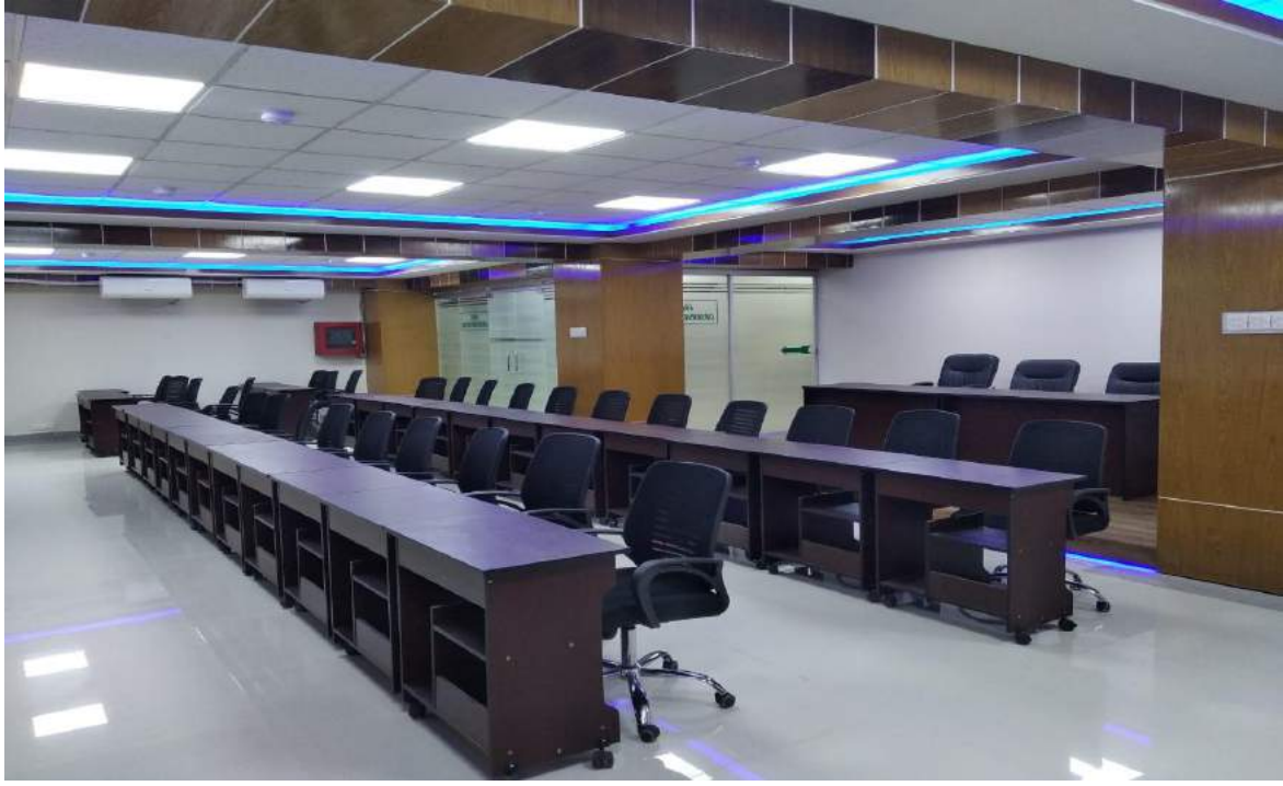
চিত্রঃ ০৯ Urban Resilience Project (DDM Part) এর আওতায় প্রস্তুতকৃত Emergency Response Coordination Center (ERCC).