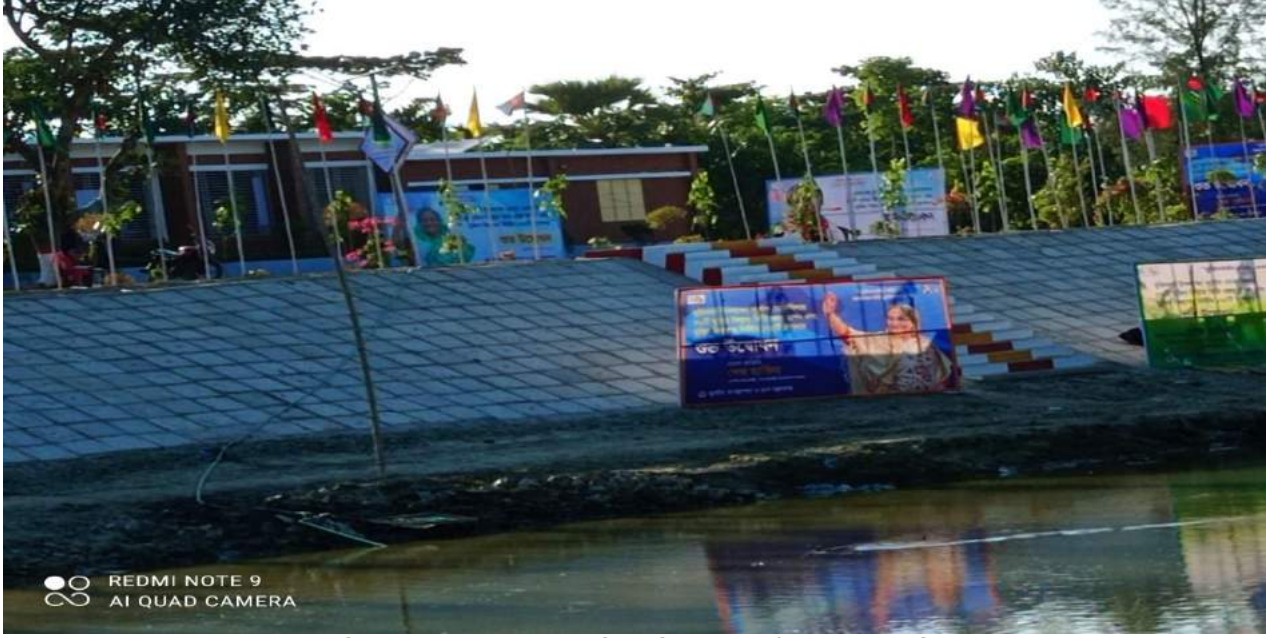
চিত্রঃ ০১ চর দরবেস মুজিব কিল্লা, সুবর্ণচর, নোয়াখালী।