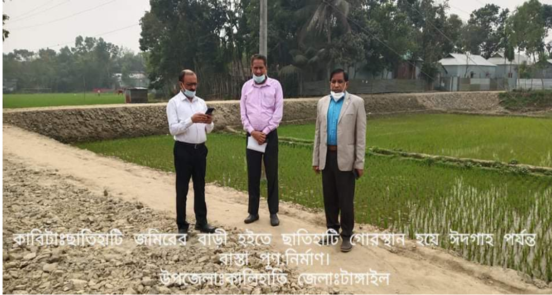
চিত্রঃ ০২ ছাত্তিহাটি জমিরের বাড়ী হতে ছাত্তিহাটি গোরস্থান হয়ে ঈদগাহ পর্যন্ত রাস্তা পুনঃনির্মাণ, উপজেলাঃ কালিহাতি, জেলাঃ টাঙ্গাইল।