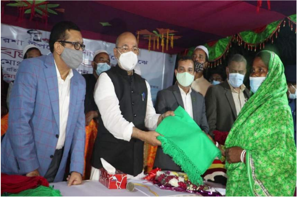
চিত্রঃ ০২ ডাঃ মোঃ এনামুর রহমান এমপি, মাননীয় প্রতিমন্ত্রী, দুর্যোগ ব্যবস্থাপনা ও ত্রাণ মন্ত্রণালয় কর্তৃক দুস্থদের মাঝে শীতবস্ত্র বিতরণ।