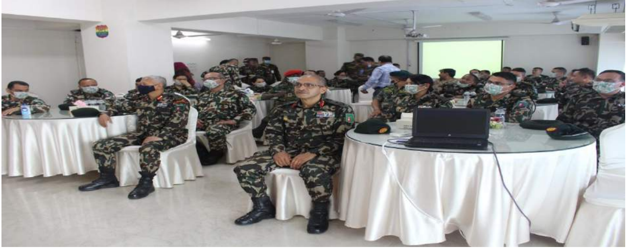
চিত্রঃ ০৩ Delegates of Nepal Army Command and Staff College এর প্রতিনিধি দলের দুর্যোগ ব্যবস্থাপনা অধিদপ্তরে পরিদর্শনকালীন পারস্পারিক অভিজ্ঞতা বিনিময় সভায় উপস্থিত সদস্যবৃন্দ।

8.১.২ Delegates of Nepal Army Command and Staff College এর প্রতিনিধি দলের দুর্যোগ ব্যবস্থাপনা অধিদপ্তরে পরিদর্শনকালীন পারস্পারিক অভিজ্ঞতা বিনিময়।