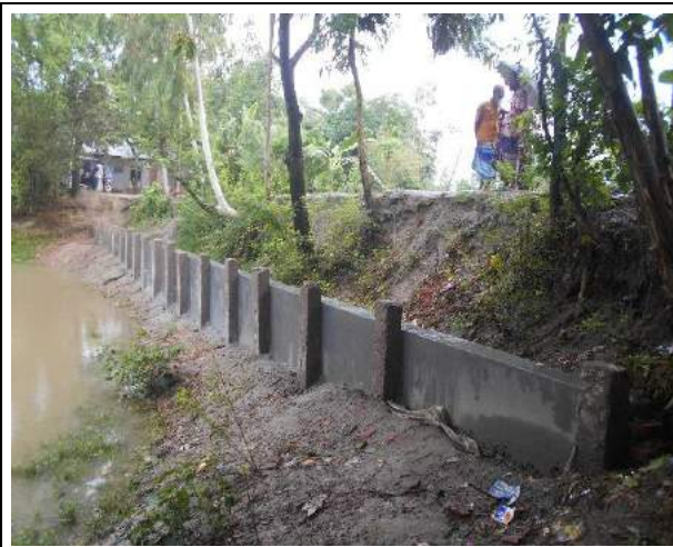
চিত্রঃ ০৬ জামালপুরে ইজিপিপি'র আওতায় বন্যা থেকে রাস্তা রক্ষায় নির্মিত গাইড ওয়াল।

বন্যা পরবর্তী সময়ে প্রাণিসম্পদের দুর্যোগ সহনশীলতা বৃদ্ধির জন্য ২টি ভ্যাকসিনেশন ক্যাম্প আয়োজন করা হয়। এছাড়াও বন্যাকালীন সময়ে গবাদি পশুর আশ্রয়ের জন্য ভিটা উচ্চকরণ করা হয়েছে। এছাড়াও ইজিপিপি'র উপকারভোগীদের জন্য ভাসমান সজি চাষ পদ্ধতির মডেল বাস্তবায়ন করা হয়।