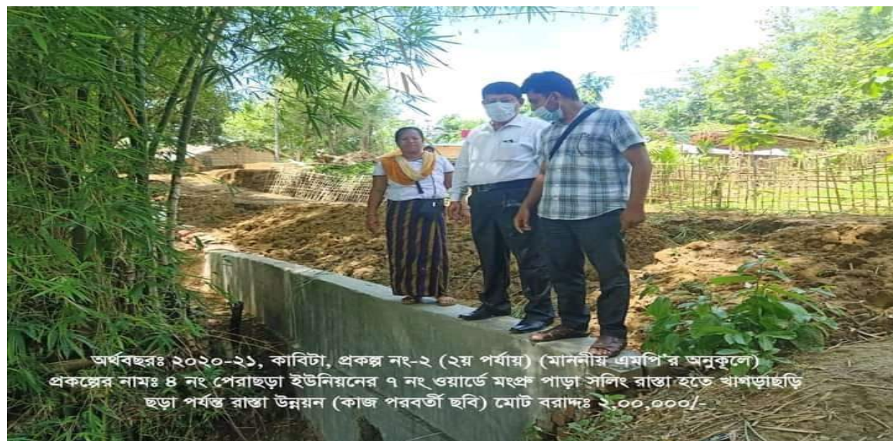
চিত্রঃ ০৪ খাগড়াছড়ি সদর উপজেলায় পেরাছড়া ইউনিয়নের ৭নং ওয়ার্ডে মংপু পাড়া সলিং রাস্তা হতে খাগড়াছড়ি ছড়া পর্যন্ত রাস্তা উন্নয়ন।