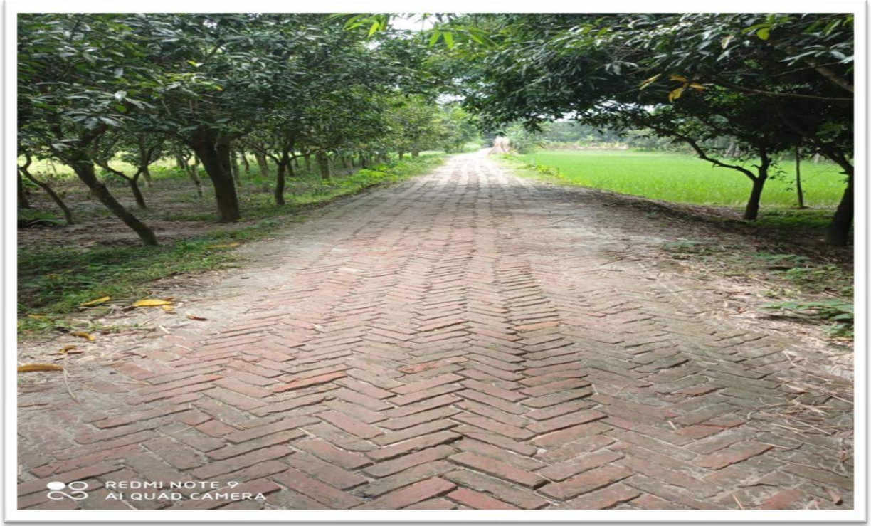
চিত্রঃ ০১ কুষ্টিয়া জেলার খোকসা উপজেলার 'বেতবাড়িয়া বৈরাগীপাড়া মোড় দুখির বাড়ি হইতে হান্নানের বাড়ি ভায়া বেতবাড়িয়া ফুড ব্রীজ পর্যন্ত (৫০০ মিটার) (ইউপি- বেতবারিয়া) রাস্তায় এইচবিবি করণ'।