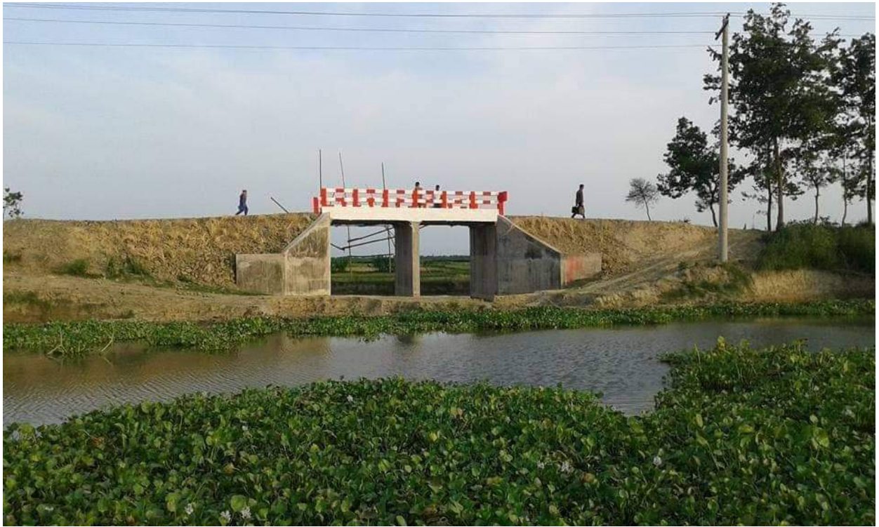
চিত্রঃ ০১ পাবনা জেলার সাঁথিয়া উপজেলায় ধুলাউড়ি ও নাগডেমড়া সংযোগ সড়কে বারআনি গ্রামে নির্মিত সেতু।

অর্থ বছরঃ ২০২০-২১ (উপজেলা ওয়ারী বিস্তারিত বিবরণ)