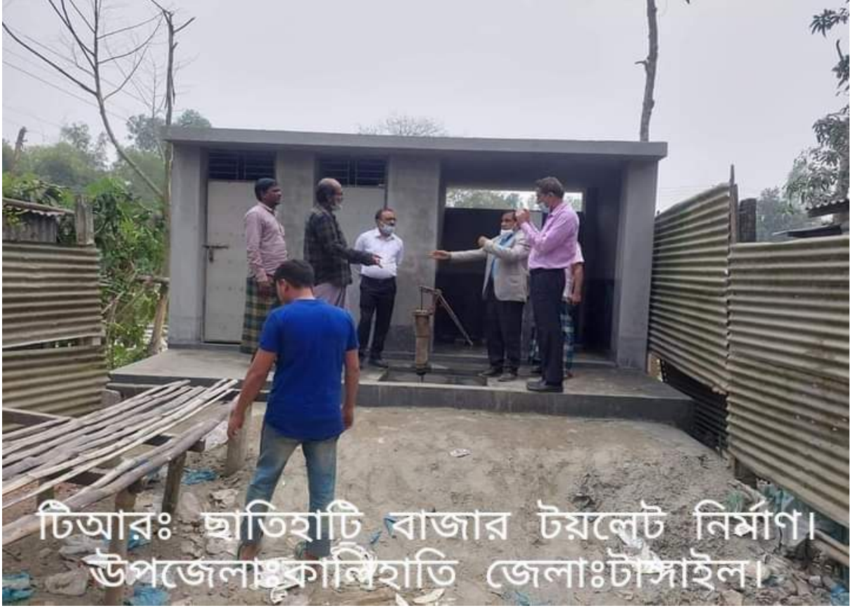
চিত্রঃ ০৩ ছাতিহাটি বাজার টয়লেট নির্মাণ, উপজেলাঃ কালিহাতি, জেলাঃ টাঙ্গাইল।