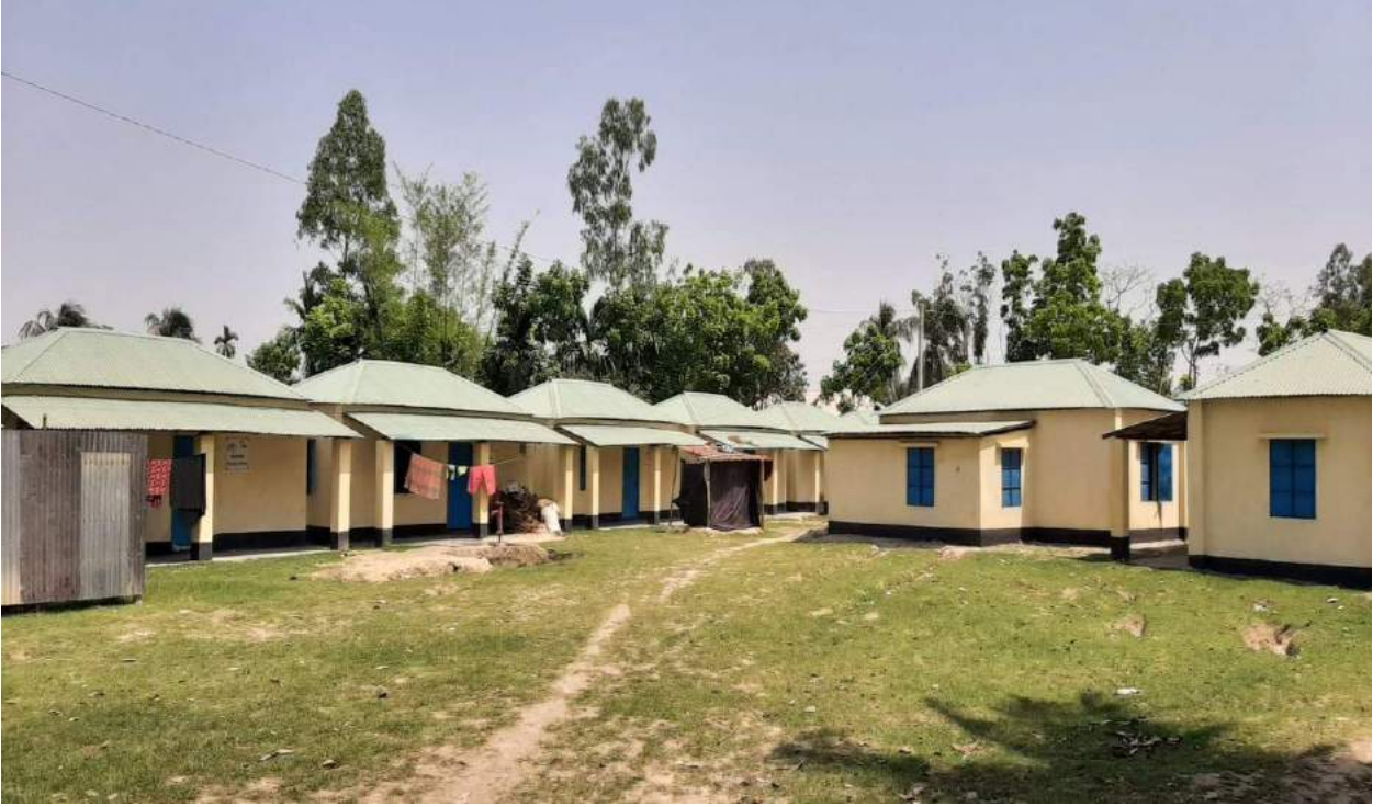
চিত্রঃ ০৫ মুজিব শতবর্ষে ‘ভূমিহীন ও গৃহহীন’ ‘ক’ শ্রেণির পরিবার পুনর্বাসনে দুর্যোগ সহনীয় বাসগৃহ, উপজেলাঃ সূজানগর জেলাঃ পাবনা।