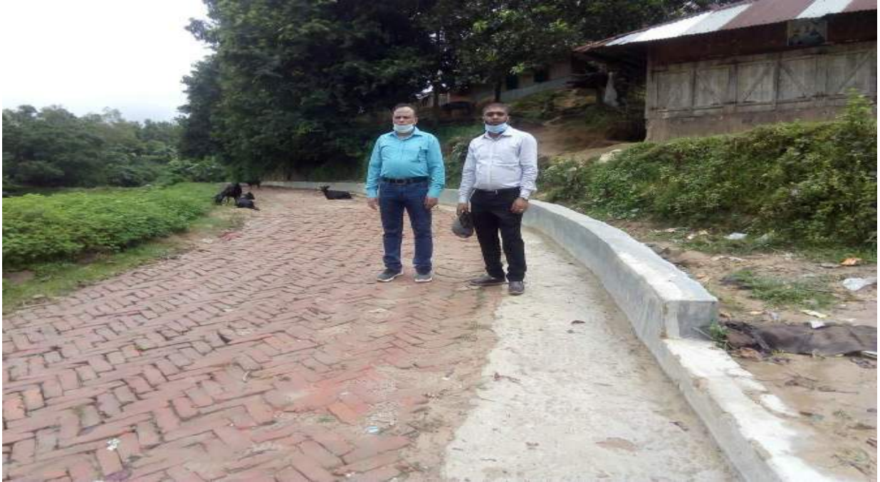
চিত্রঃ ০৪ সহকারী প্রকল্প পরিচালক ও সংশ্লিষ্ট উপজেলার PIO কর্তৃক খাগড়াছড়ি জেলার 'রামগড় উপজেলার ১ নং রামগড় ইউপির বুপাইছড়ি স্কুল হতে পৌরসীমানা দিকের রাস্তা পর্যন্ত এইচবিবি করণ' প্রকল্প পরিদর্শন ।