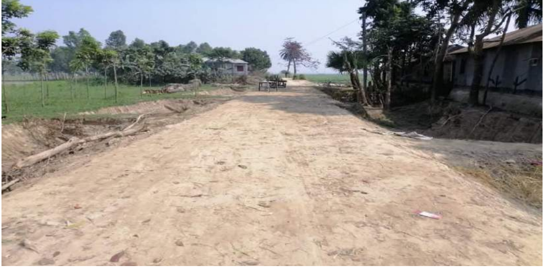
চিত্রঃ ০১ রুপসী মাঠের আকবর আকন্দের জমি হতে ধলাগাড়ীর দিকে রাস্তা সংস্কার, উপজেলাঃ ভাঙ্গুরা, জেলাঃ পাবনা।