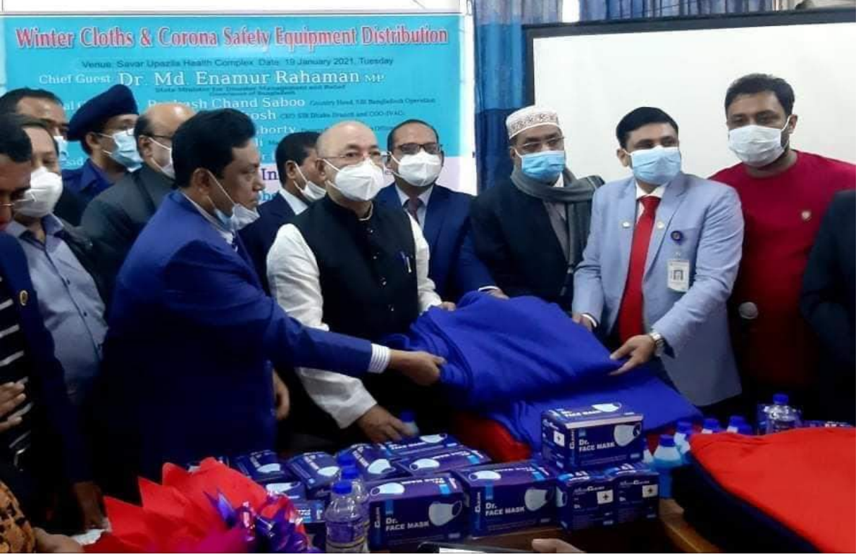
চিত্রঃ ০১ ডাঃ মোঃ এনামুর রহমান এমপি, মাননীয় প্রতিমন্ত্রী, দুর্যোগ ব্যবস্থাপনা ও ত্রাণ মন্ত্রণালয় কর্তৃক সাভার উপজেলা স্বাস্থ্যকমপ্লেক্স চত্বরে দুস্থদের মাঝে শীতবস্ত্র ও করোনা সুরক্ষা সরঞ্জাম বিতরণ।