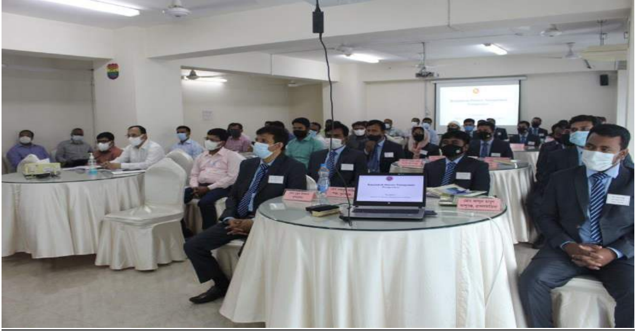
চিত্রঃ ১৬ দুর্যোগ ব্যবস্থাপনা অধিদপ্তরের আওতায় সংশ্লিষ্ট কর্মকর্তাদের প্রকল্প প্রণয়ন অনুমোদন ও বাস্তবায়ন বিষয়ক প্রশিক্ষণ।