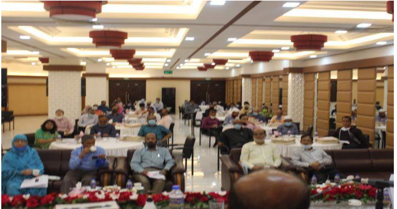
চিত্রঃ ০৭ বিয়াম মাল্টিপারপাস হল "অতিদরিদ্রদের জন্য কর্মসংস্থান কর্মসূচি (ইজিপিপি)" বাস্তবায়ন সংক্রান্ত দিনব্যাপী কর্মশালায় উপস্থিত অংশগ্রহণকারীগণ।