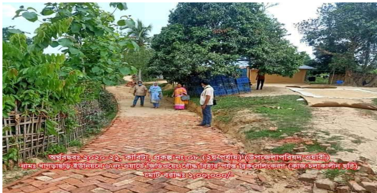
চিত্রঃ ০৩ খাগড়াছড়ি সদর উপজেলায় খাগড়াছড়ি ইউনিয়নের ৬নং ওয়ার্ডে জিডিওয়েং থেকে বৌদ্ধ বিহার পর্যন্ত ব্রিক সলিং করা রাস্তা।