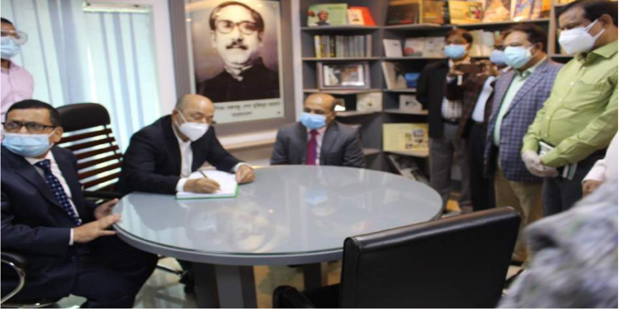
চিত্রঃ ০৩ ডাঃ মোঃ এনামুর রহমান এমপি, মাননীয় প্রতিমন্ত্রী, দুর্যোগ ব্যবস্থাপনা ও ত্রাণ মন্ত্রণালয় কর্তৃক দুর্যোগ ব্যবস্থাপনা অধিদপ্তরে স্থাপিত মুজিব কর্নারের পরিদর্শন বইতে স্বাক্ষর।